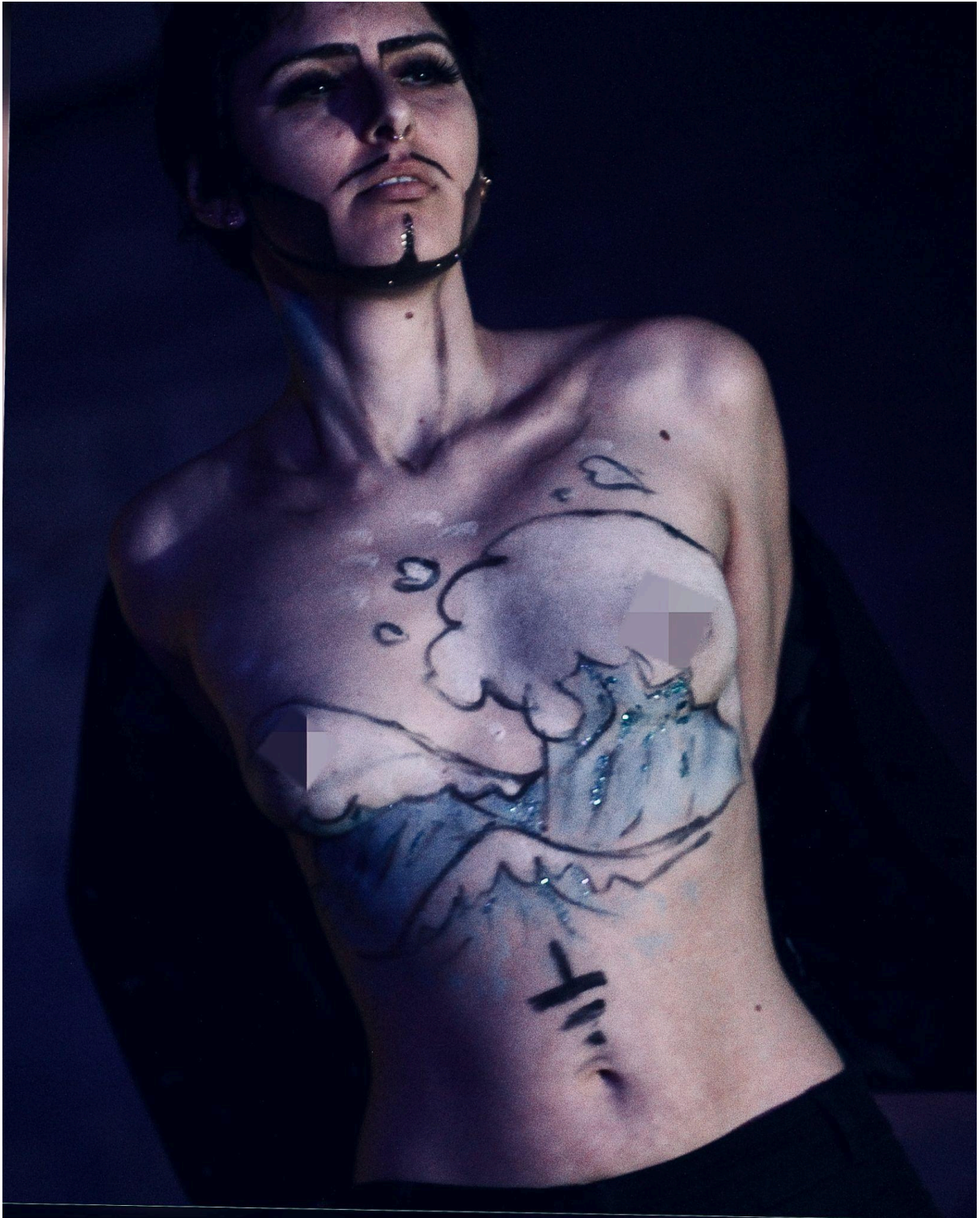
scène à l'île égalité Villerbanne