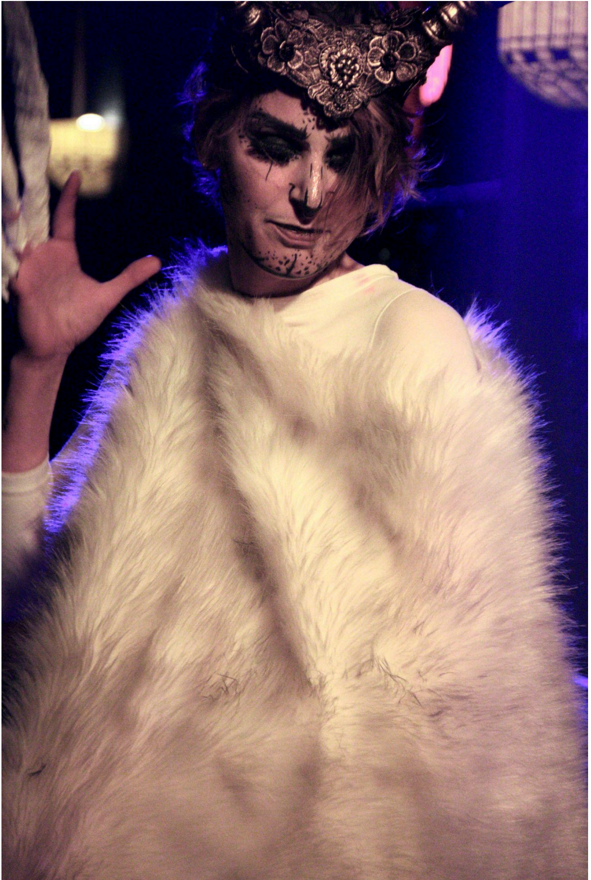
scène harper's Grenoble février