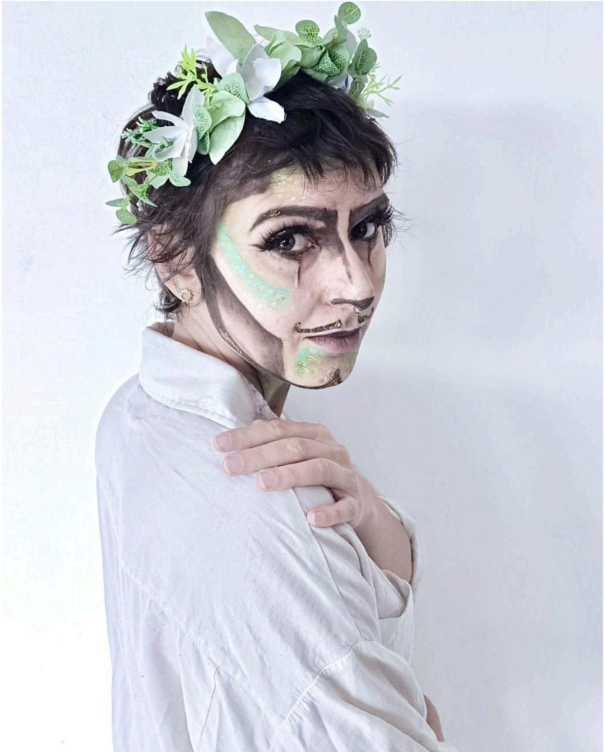
Résidence du collectif @les_queerass