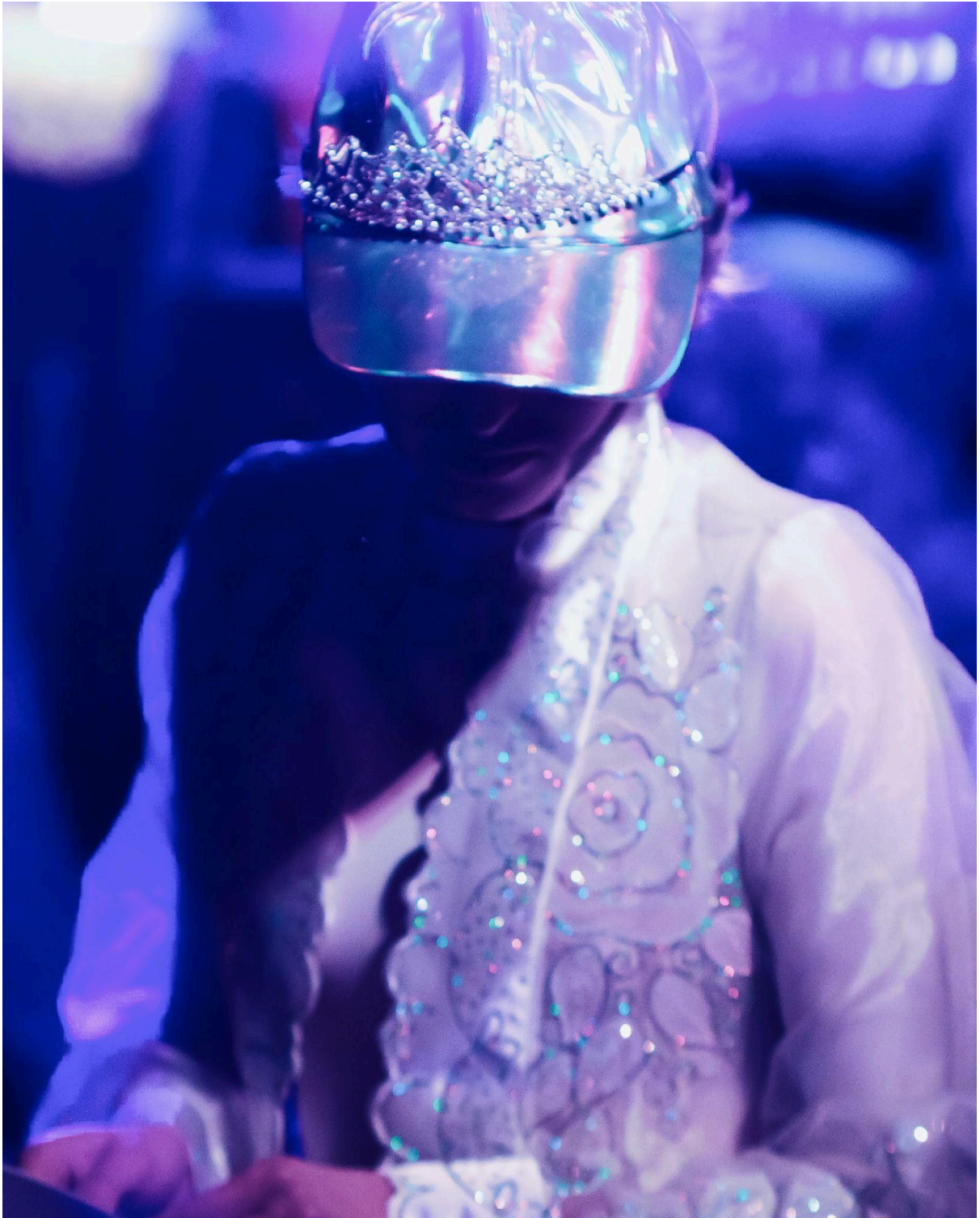
scène harper's Grenoble janvier