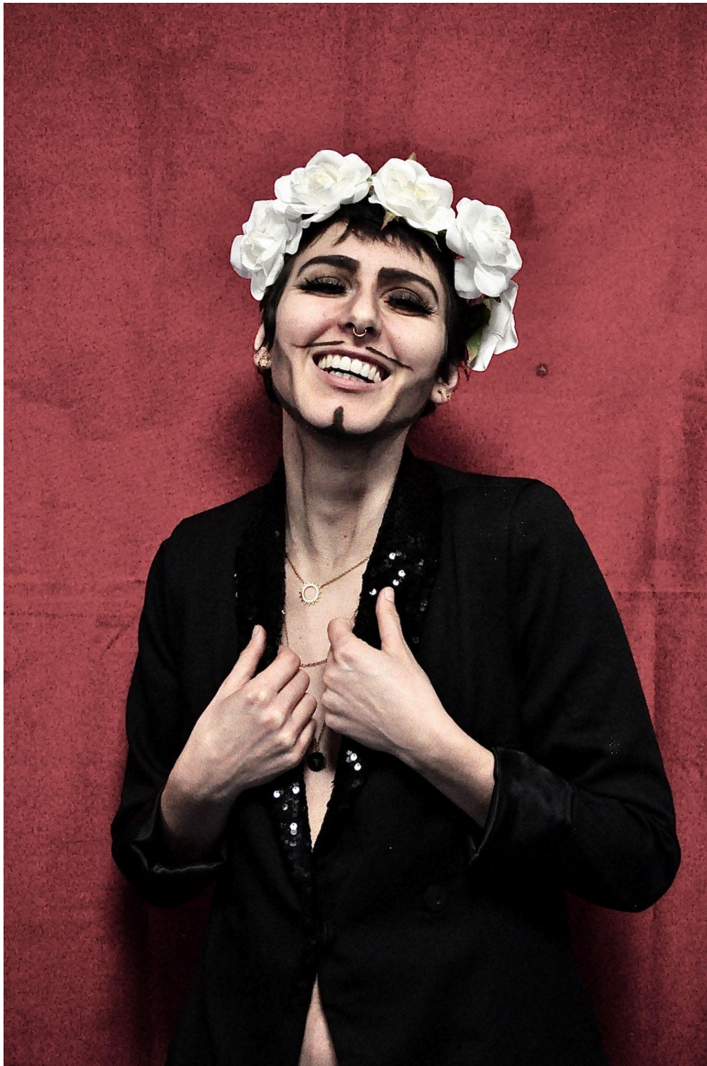
scène à Charlieux